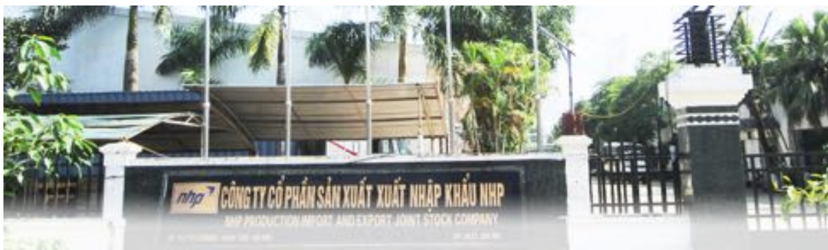
Hình ảnh: Nhà máy sản xuất của Công ty