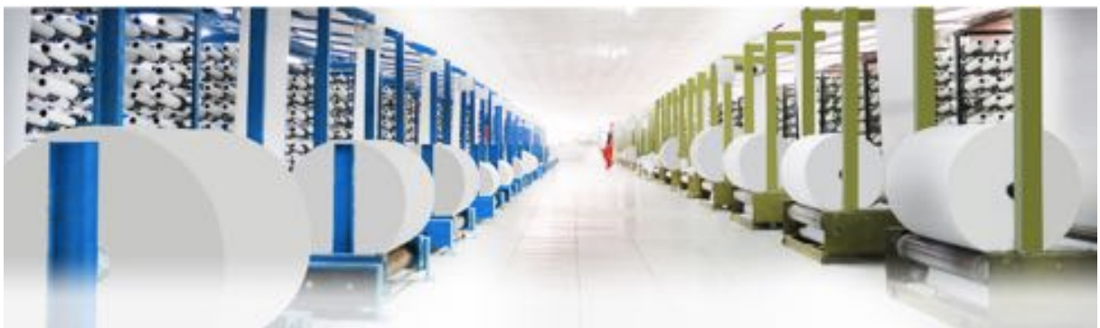
Hình ảnh: Xưởng sản xuất của Công ty