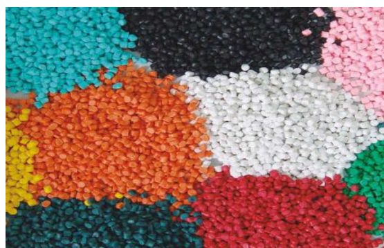
Hạt nhựa PP